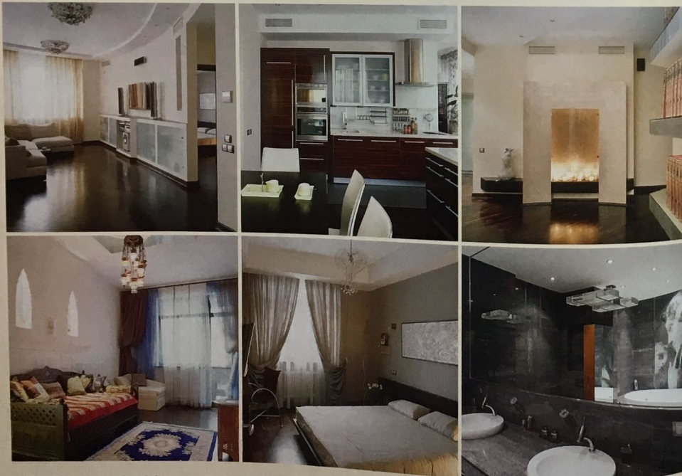
4. Детская. Площадь — 20,2 м 2 . Стены: линкруст, обои, покраска — поставщик « Опус » (Москва). Двери из массива дуба — Романголи (Италия). Потолок: краска — Jub, Jupol (Словения)