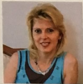
Автор проекта: архитектор Ольга Слѣзкина (г. Москва)

«Присоединение балконов не только позволило увеличить полезную площадь, но и обеспечило свободное проникновение солнечного света в комнаты»